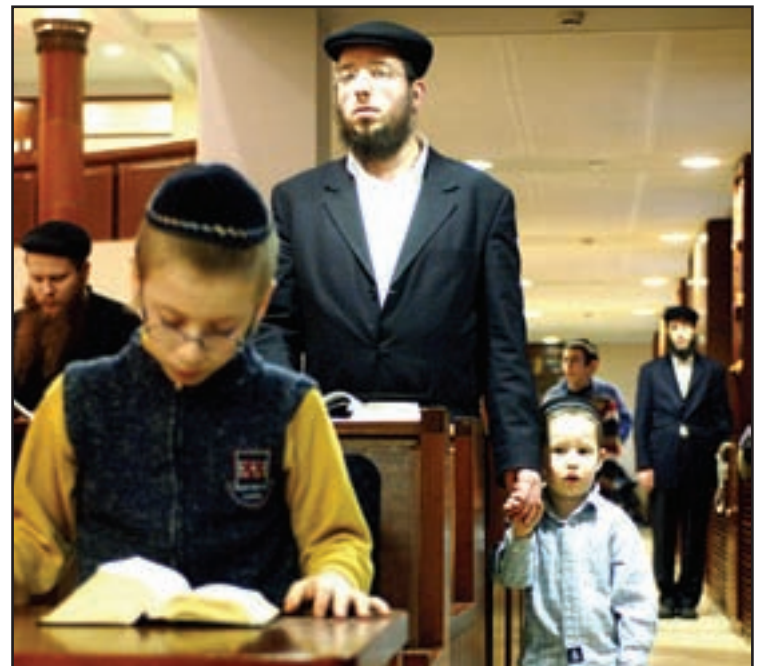
Hudiunan ta resa pa e Prome minister Israeli Ariel Sharon den e Sinagoga na Moscu diadomingo. Un scan di e celebracion di Ariel ta muestra un mehoransa den e celebracion y docternan ta cuminsa saca e prome minister Israeli poco poco for di coma induci, segun un oficial di hospital.